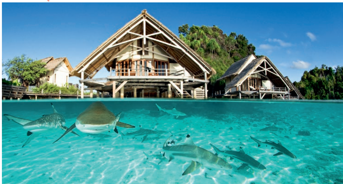
Näher an Haien kann man wohl nicht wohnen. Für die Gäste der Wasserbungalows beträgt die Entfernung nur eine Treppenstufe.

Nach dem Abtauchen bekommen wir tatsächlich einen Epaulettenhai zu Gesicht, versteckt in einer Höhle. „Walking shark“, gehender Hai, wird der endemische Meeresbewohner genannt. Es gibt den raren Vertreter seiner Gattung, kaum einen Meter groß, nur im Gebiet von Raja Ampat. Ebenfalls gut getarnt: der Wobbegong, ein seltsames, fransiges Wesen, das sich kaum abhebt vom Grund, auf dem es ruht. Deshalb sein Name: Teppichhai. Wir tauchen weiter, nähern uns stattlichen Napoleon-Lippfischen und werden danach Teil eines Barrakudaschwarms. Es sind mehr als 100 der kapitalen Raubfische, mit denen wir uns gegen