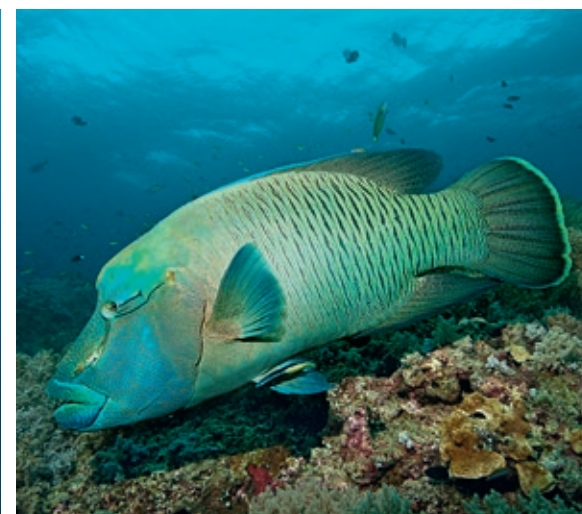
Die neugierigen Fledermausfische beäugen Taucher gern beim Sicherheitsstopp (links). Kapitabler Riffbesucher: Napoleon-Lippfisch (rechts).