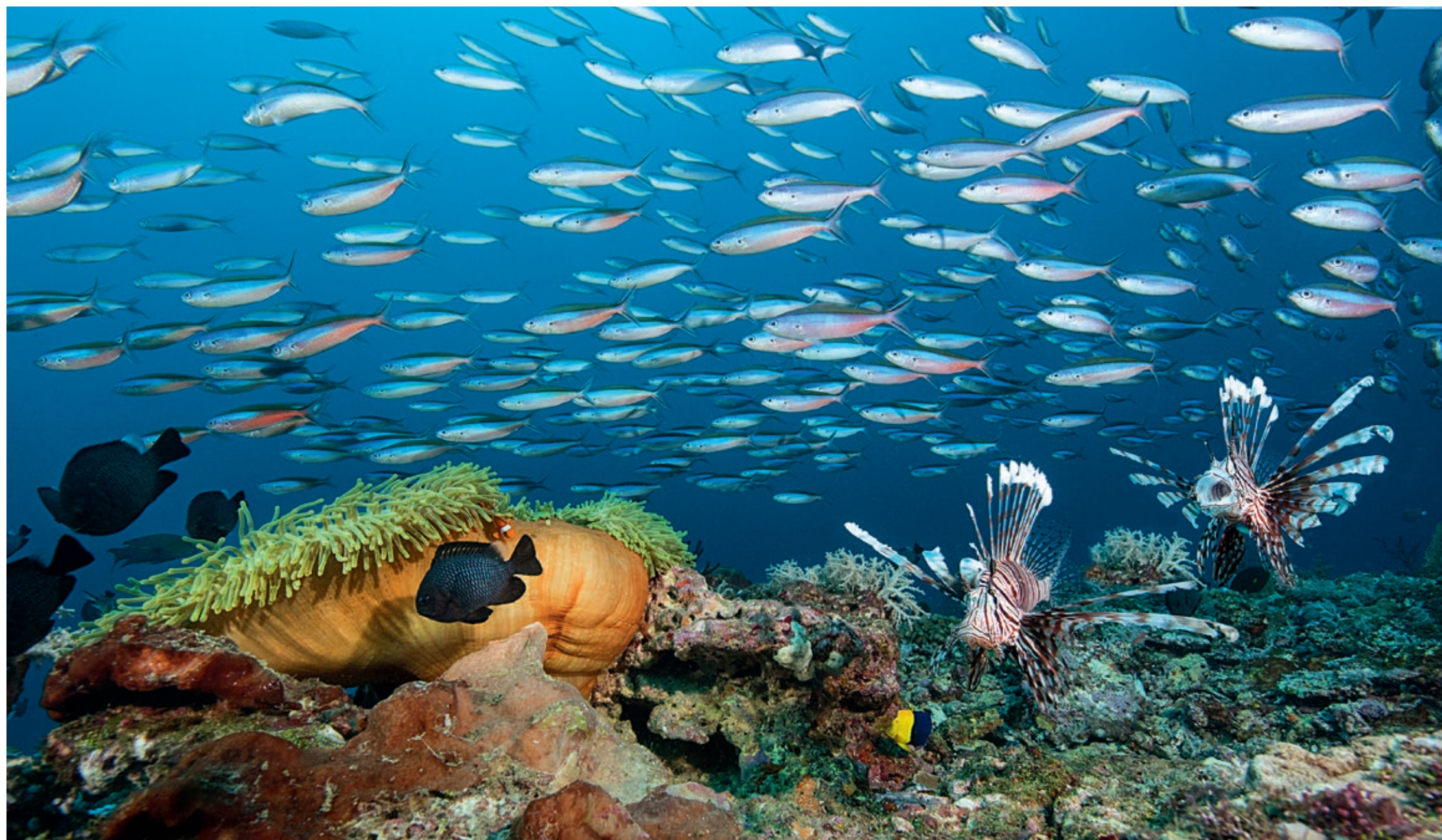
Typische Riffszene in Raja Ampat: Oben zwischen Neon-Füsiliere übers Riff hinweg, während sich knapp darunter zwei Rotfeuerfische auf die Jagd begeben.