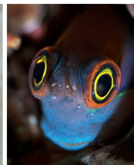
Angriff ist die beste Verteidigung: Eine Langscheren-Korallenkrabbe zeigt dem Fotografen seine Grenzen (links). Was für hübsche Augen! Diese gehören zu einem Schwanzfleck-Kammzähler (rechts).

Nord-Sulawesi & Nusa Lembongan / Bali Indonesien