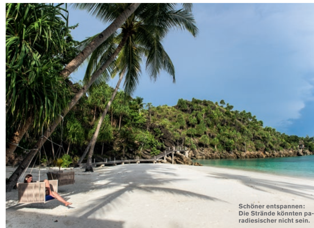
Schöner entspannen: Die Strände könnten paradisischer nicht sein.